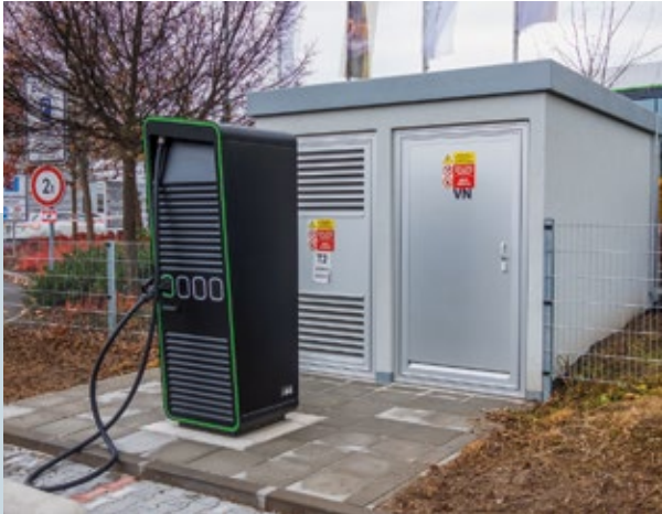
AUTO JAROV PRAHA