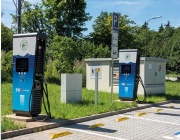
ČERPACÍ STANICE ŽACLÉŘ